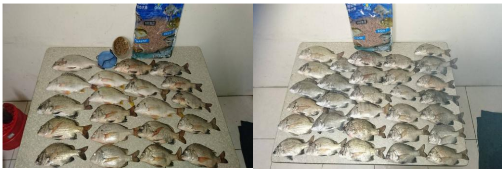
滿滿黑格在鹿港代言人, 在彰濱工業區南堤 泡豆練餌丸誘釣的